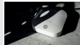
Alimentatore Yale Sync Smart Home per mettere in sicurezza la casa

Il nuovo Yale Sync Smart Home permette di avere pieno controllo sulla sicurezza della propria casa. Grazie ad una facile installazione, il kit comprende elementi già collegati e connessi tra di loro grazie fino a 40 accessori. Tra gli accessori a disposizione troviamo la presa intelligente che può essere utilizzata per accendere le luci o radure e simulare la presenza in casa.