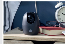
Telecamera smart per interni

Le telecamere Wi-Fi da interno Pan & Tilt e Full HD permettono di tenere d'occhio le diverse stanze della casa, la telecamera Wi-Fi per porta d'ingresso si focalizza sul punto d'entrata, con l'accensione delle luci per un'immagine accurata quando vengono rilevati movimenti, mentre la telecamera da esterno Wi-Fi Pro è il kit di base consentendo di controllare il giardino e gli edifici esterni.